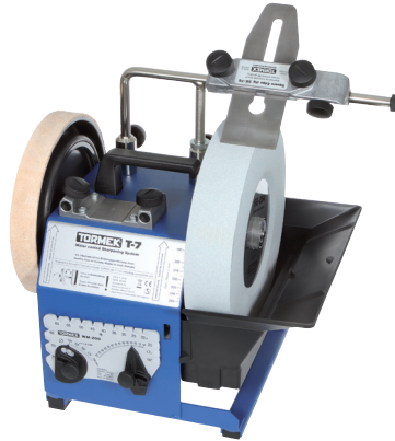
TORMEK T-7 (nicht mehr verfügbar)